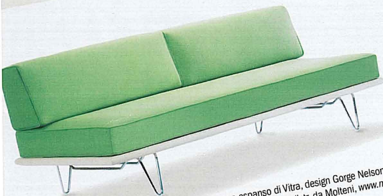
Divano con piano in acero, sedute in poliuretano espanso di Vitra, design Gorge Nelson '48 (l 1.900 cm, h 660 cm p 620 cm, 5.047 euro, www.vitra.com distr. da Molteni, www.molteni.it ).