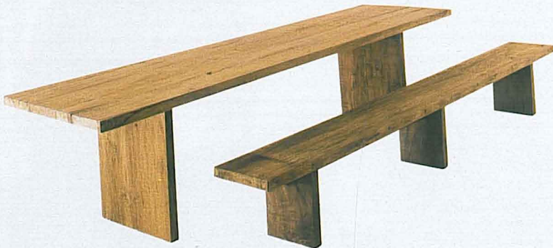
Tavolo e panca in tek a finitura grezza Carpenter di Tisettanta (tavolo: h 73 cm, l 300 cm, p 80 cm, 4.473 euro. Panca: h 42 cm, l 300 cm, p 35 cm, 1.749 euro. Tel. 0362.3191, www.tisettanta.com ).