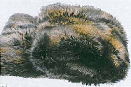
Divano in pelliccia di procione di Zoeppritz (140x190 cm, 1.900 euro, www.zoeppritz.com in vendita c/o Molteni Zoeppritz La Rinascente, tel. 02.88521).